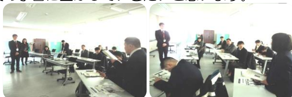
アイエスエフネットライフいわき