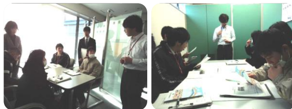
いわき障害者就業・生活支援センター