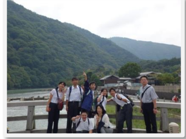
ぼくとみんなで集合写真を撮っている。