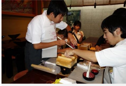
初めて八橋作りをしました。

そして、嵐山の「竹林の道」や「渡月橋」を散策して、たくさん記念写真を撮りました。また、道すがら、京都の漬物やアイスを味わいました