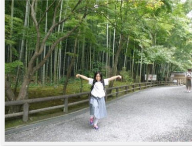
竹林の道で1人で撮りました。グリコです。