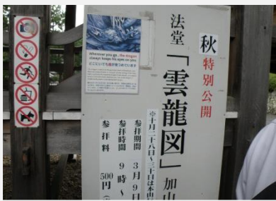
寺の中で大きい龍に会いました。いろんな所を歩いても龍の目が見ている。

さらに、「金閣寺」は、2万枚の金箔を貼りつけてあることを添乗員の方に教えてもらいました。観光中、外国の方に「Hello.」「See You.」と言ってコミュニケーションをとる姿が見られました。