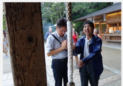
S先生と神社でお参りしている。

京都の街並みを散策した後、お土産を買ったり夕食でバイキングをしたりしました。ホテルの部屋では、しっかり休んで明日のためにエネルギーをチャージしました。