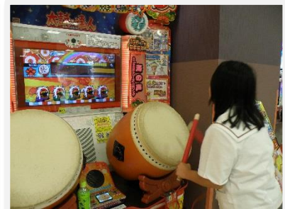
イオンで太鼓の達人をしました。楽しかったです。また、行きたいです。