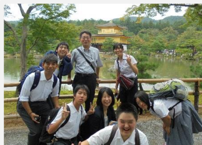
金閣寺で集合写真を撮りました。