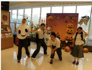
ホテルでハロウィンの格好をして写真を撮りました。

京都の街並みを散策した後、お土産を買ったり夕食でバイキングをしたりしました。ホテルの部屋では、しっかり休んで明日のためにエネルギーをチャージしました。