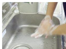
11月6日(金)に手洗いの勉強をしました。(HP掲載)