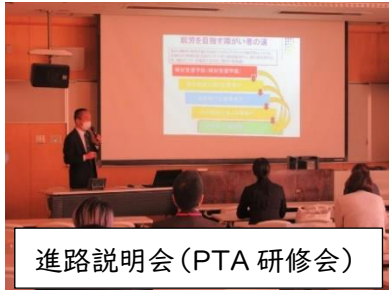
進路説明会 (PTA 研修会)