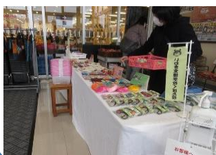
農産物直売所そのふぁ