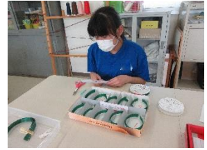
校内実習(アウトソーシング班)