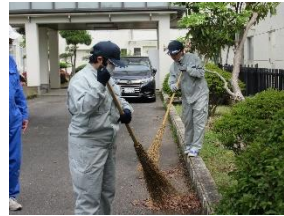
校内実習(トータルクリーン班)