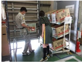
ヤマト運輸 いわき泉センター

2、3年生は校外で実習を行いました。企業や福祉事業所で様々な仕事に挑戦し、卒業後に向けて充実した実習になったかと思ひます。一部、実習の様子を写真で紹介しします。