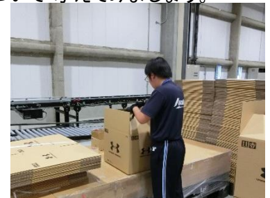
(ドームいわきベース)