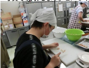
(ありがとうカンパニー)

2、3年生は校外での実習となりました。企業や福祉事業所で様々な仕事に挑戦し、卒業後の進路に向けて充実した実習を行うことができたかと思えます。一部になってしまいますが、実習の様子について写真で紹介しします。2、3年生もそれぞれの課題や進路希望先との適性について考えてみましょう。