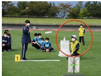
特別支援学校スポーツ大会