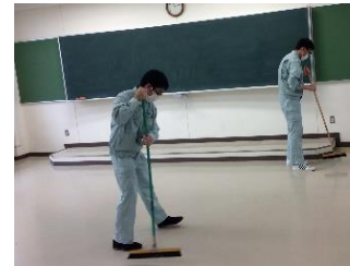
ビルクリーニング班