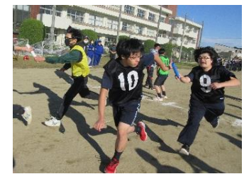
勿来高校体育祭に参加

高等学校や近隣の学校、及び地域の方々の協力を得ながら様々な活動に参加しています。