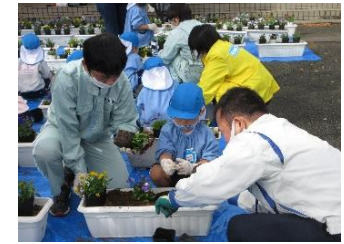
花が育む高校生と地域の交流支援事業

高等学校や近隣の学校、及び地域の方々の協力を得ながら様々な活動に参加しています。