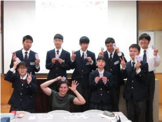
総合的な探求の時間

各教科(国語 数学 音楽 保健体育 職業)、各教科等を合わせた指導(日常生活の指導、生活単元学習)、自立活動、道徳、総合的な探求の時間、特別活動