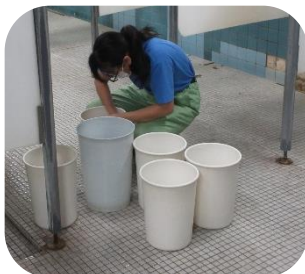
小名浜製錬株式会社