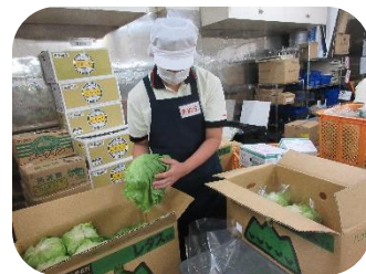
マルト SC 中岡店