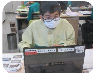
さんしゃんクレハ